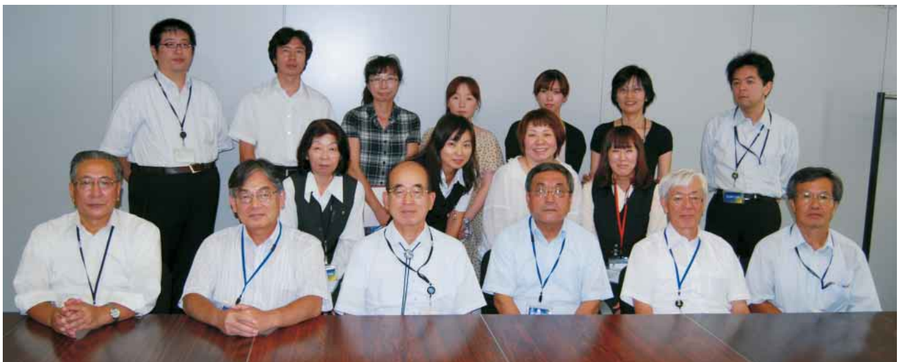
筆者は前列左から二人目

安全の確保を前提に原子力・放射線利用は、原子力発電のみならず医療および学術研究での放射線利用という形で国民生活において深く関わっている。しかしながら、放射線がヒトに及ぼす影響、特に低線量域放射線が及ぼす健康影響については放射線防護という観点から国民の関心が高く国民への正しい情報の発信が求められている。低線量域放射線被ばくがヒトに与える健康影響については未解明の点もおおく、これを直接的に観察する疫学調査の役割は決して小さくない。その意味からも、原子力発電施設等で放射線業務に携わる従事者を対象として健康影響の調査を実施している放射線疫学調査センターの役割は大きいと思われる。