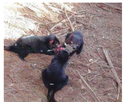
きょうだいで生肉の争奪戦をするタスマニアデビル