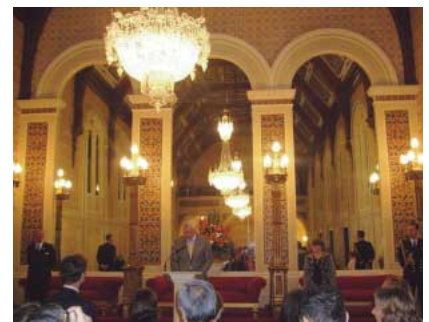
タスマニア州迎賓館での知事の挨拶